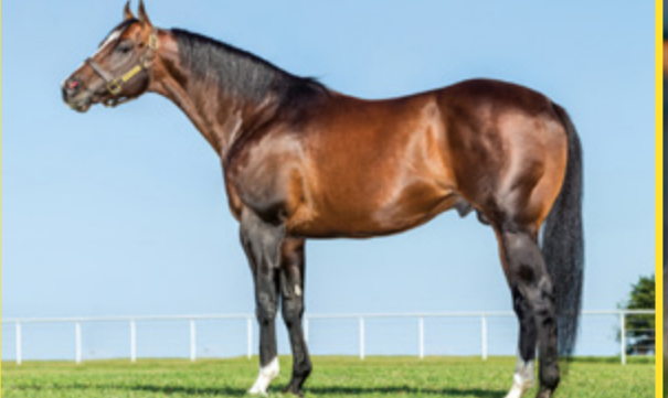
COBERTA POR DESIRIO EM 29/09/2024