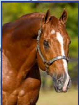
COBERTA de GOLD MEDAL JESS